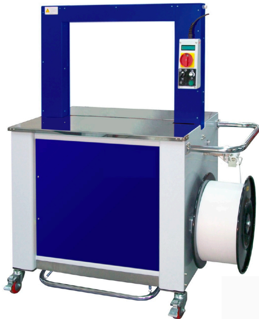
Sematic 7 pour feillard 12 mm