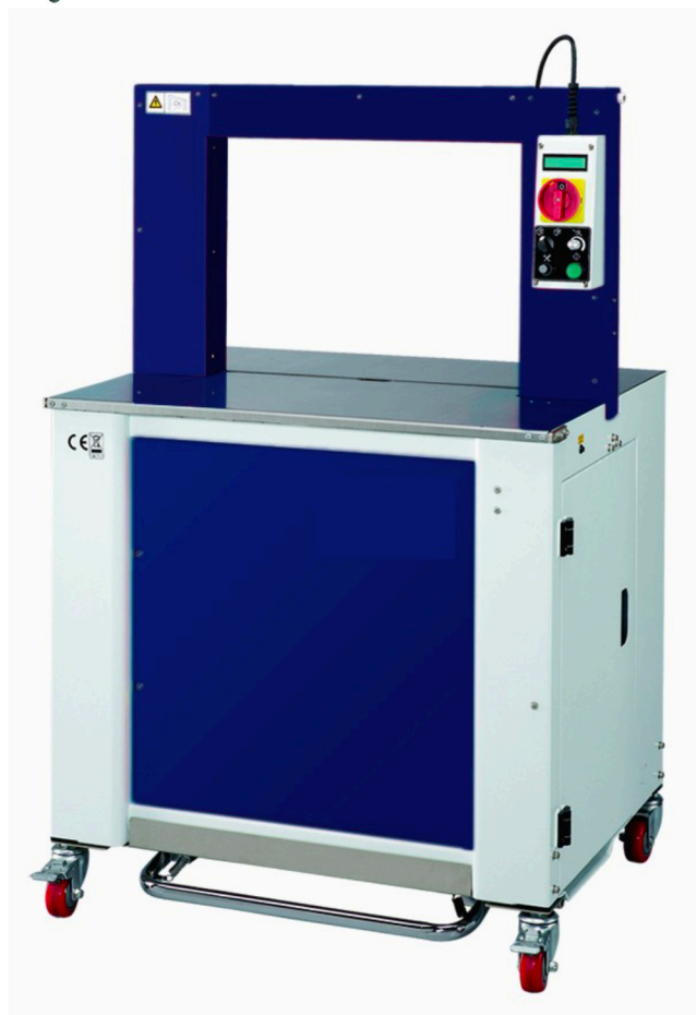
Sematic 7 pour feillard 5, 8 et 9 mm